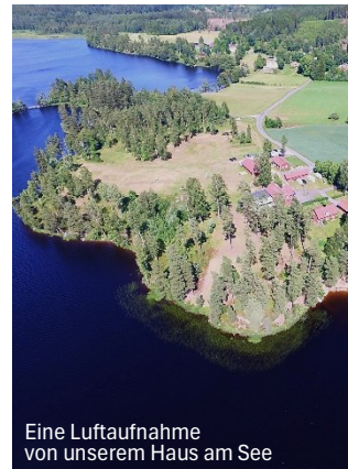
Eine Luftaufnahme von unserem Haus am See