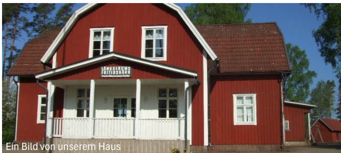
Ein Bild von unserem Haus

Im Mittelpunkt unserer Freizeiten steht unser Glaube an Gott. Die Gemeinschaft mit Jesus und miteinander sind für unsere Freizeiten zentral. Wir sind davon überzeugt, dass unser Glaube einen großen Unterschied in unserem Leben macht – gerade auch in der Art, wie wir Beziehungen leben. Das kann man auf einer zweiwöchigen Sommerfreizeit gut erleben. Deswegen sollen unsere Freizeiten auch immer eine Möglichkeit sein, Jesus besser kennenzulernen, von ihm zu lernen und ihm in unserer Gemeinschaft zu begegnen.